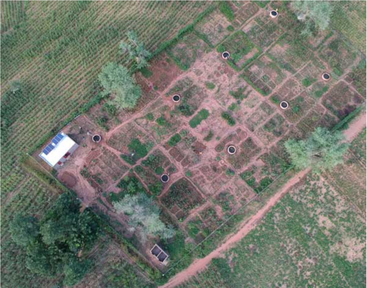
Hierboven Komongalou vanuit de lucht